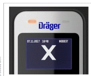
"Согтууруулах ундаа илэрсэн" тэмдэг