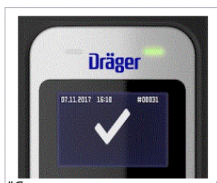
"Согтууруулах ундаа илрээгүй" тэмдэг