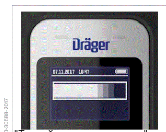
"Тестийн явцыг харуулах" тэмдэг